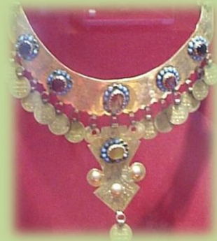
Нагрудное украшение «лунница»

В старину у казанских, сибирских, астраханских татар в высшем сословии, вероятно близком к ханскому окружению, бытовали драгоценные ювелирные украшения. Они выполнялись из чеканных позолоченных пластин в форме лунницы (айчык), инкрустировались драгоценными камнями и самоцветами.