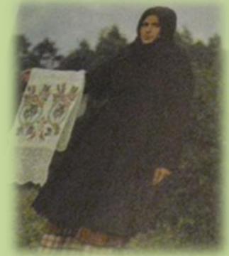
Демисезонная одежда кряшенки