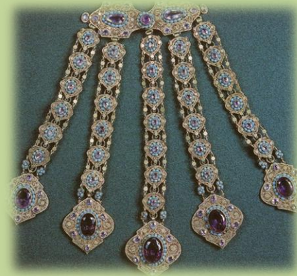
Воротниковая застежка «яка чылбыры» . Серебро, позолота, самоцветы, скань, инкрустация камнями