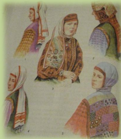
Способы повязывания тастаров

Татарки плотно повязывали голову, надвинув платок глубоко на лоб и завязав концы на затылке — так его носят и сейчас.