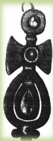
Татарские серьги второй половины XIX в.