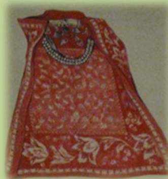
Головное покрывало молодых женщин « француз яулык»