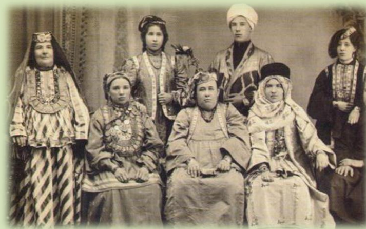
Семья казанского купца. Конец XIX – начало XXв.

Народный костюм является самым ярким индикатором национальной принадлежности человека.