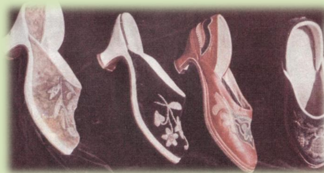
Женские узорные туфли