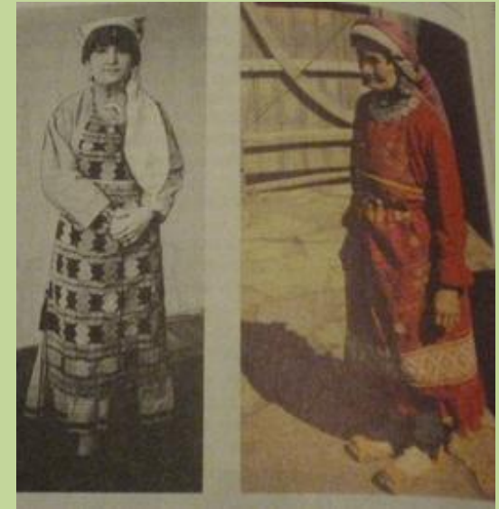
Девушка - кряшенка в домотканом переднике.