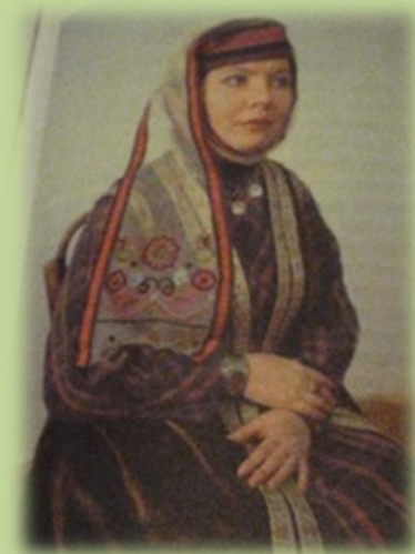
Тастары касимовских татар. XIX в.