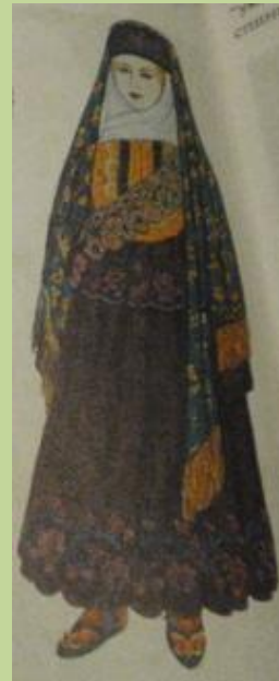
Одежда молодой женщины. Середина XIX в.