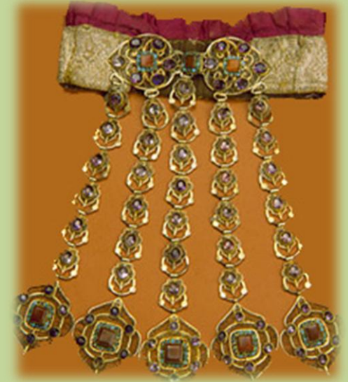
Шейное украшение на матерчатой основе «яка чылбыры»

У казанских татар преобладали нагрудники, украшенные позументом и ювелирными накладными бляхами, у сергачских мишарей, кряшен, у кузнецко-хвалынских мишарей — богато расшитые золотой гладью, у зауральских татар, как и у сопредельных башкир, сплошь декорировались кораллами и бисером и т.д.