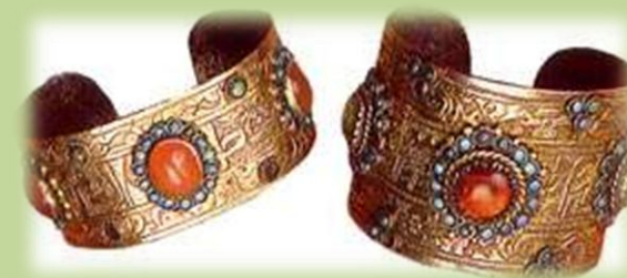
Пластинчатые браслеты - «белазек» Серебро с позолотой. Сердолик.

Украшения передавались в семье по наследству, постепенно дополняясь новыми вещами. Татарские ювелиры - "комешче" - работали обычно по индивидуальным заказам, что обусловило большое разнообразие дошедших до наших дней предметов.