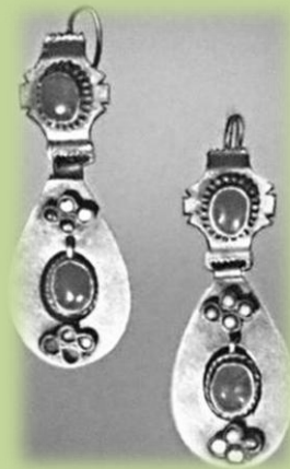
Серьги. Серебро, бирюза, сердолик, позолота