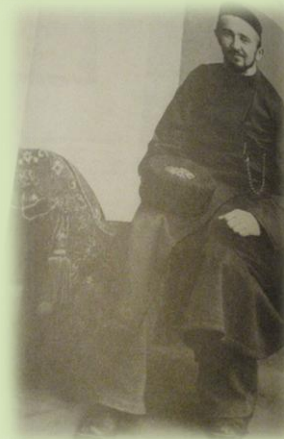
Костюм знатного татарина. Середина XIX в.