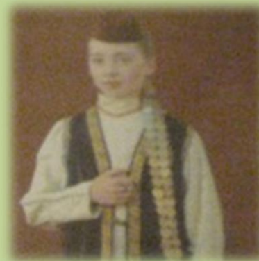
Девочка в шапочке «такья». Конец XIX в.