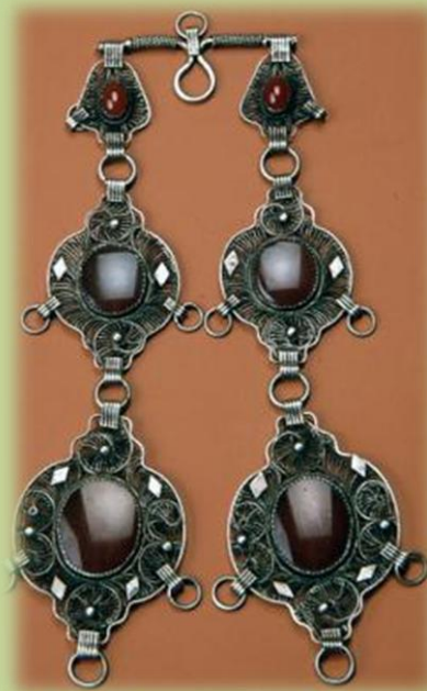
Чулпа (коромысло) — накосник. Казанская губерния. XIX в.

Среди головных украшений самое широкое распространение у всех групп женщин имели накосники. Они были чрезвычайно разнообразны по форме, материалу и технике изготовления, по особенностям декоративно-художественного оформления и способам ношения. Кроме многочисленных вариаций монетных накосников, широко бытовали накосники в виде фигурных блях преимущественно лопастной формы.