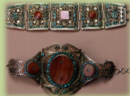
Составные ажурные браслеты.