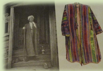
Священнослужитель в чапане. Конец XIX в.