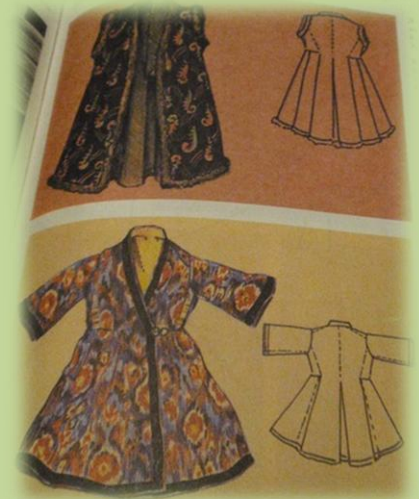
Женский камзол с меховой оторочкой. XIX в.