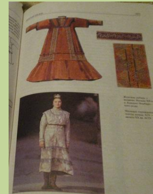
Женская рубашка с воланом. Начало XXв.