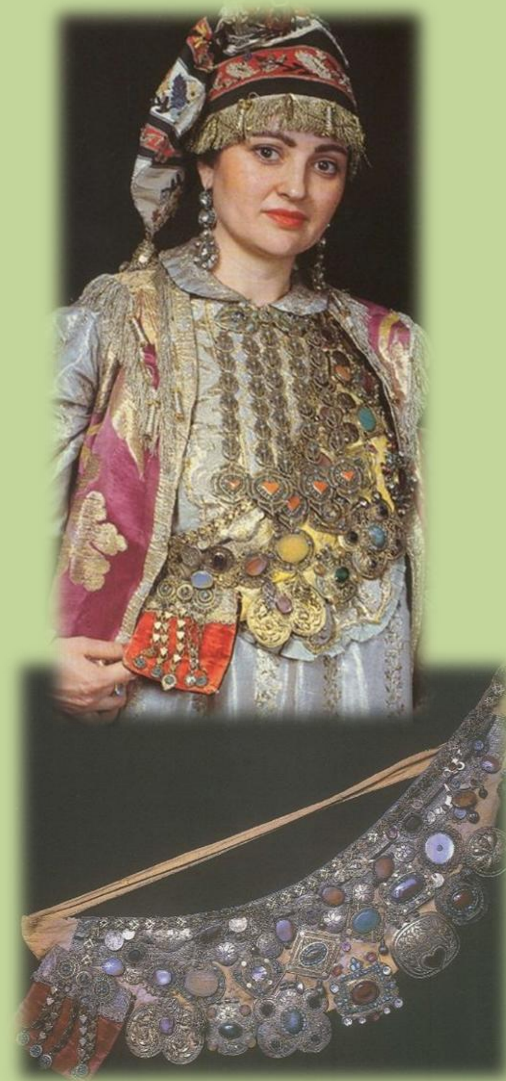
Нагрудная перевязь (хэситэ)

Нагрудная перевязь - синтез оберега, ювелирных украшений и индивидуального имущества женщины.