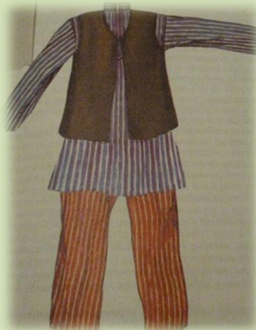
Нижняя мужская одежда. Конец XIX – начало XXв.

Головным убором мужчин была четырёхклинная, полусферической формы тюбетейка (тубэтэй) или в виде усечённого конуса (кэлэпуш). Праздничная бархатная позументная тюбетейка вышивалась тамбурной, гладьевой (чаще золотошвейной) вышивкой.