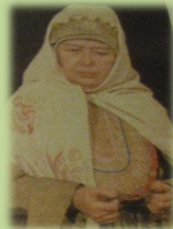
Казанская татарка в «өрпәк»