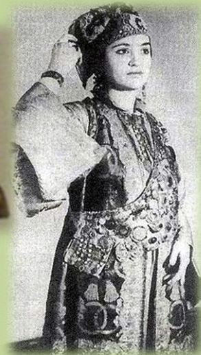
Казанская татарка в расшитом головном уборе – калфаке и перевязи с камнями, жемчугом и монетами – буту. 1907 г.