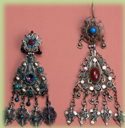
Серьги. Казанская губерния, начало XX в.