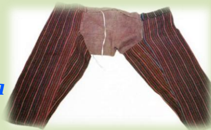
Штаны. Середина XIX в.