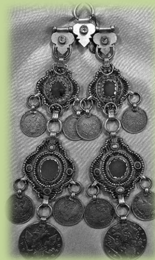
Чулпа — накосник с коромысликом. Четыре ажурные бляхи и 10 монет. Серебро, позолота, сердолик, бирюза. XIX в.