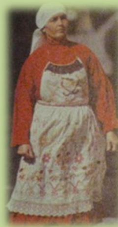
Женщина в вышитом переднике

Традиционная татарская «чоба», как правило, была двубортной, с закрытым воротом и боковыми клиньями от талии. Эта одежда расшивалась орнаментами, украшалась мехом и подпоясывалась кушаком.