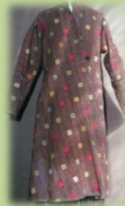
Верхний женский халат «чоба». Конец XIX в.