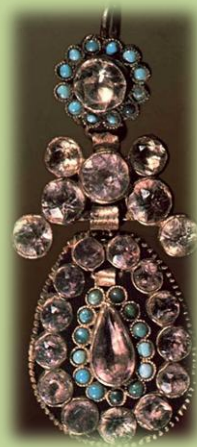
Серьги. Конец XIX - начало XX в. Серебро, бирюза, аметист, стекло; позолота.