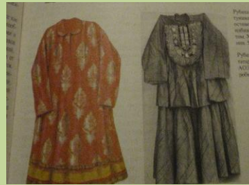
Рубашка с цельным туникообразным остовом. XIX в.

Традиционная туникоподобная рубашка в середине 19 века стала более нарядной - с развитием торговли в обиходе мусульманок появились новые шелковые и хлопчатобумажные ткани, и одежда стала украшаться воланами, кружевами, аппликациями, лентами и кистями.