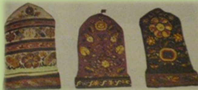
Девичьи калфачки. Середина XIX в.

Калфаки были разными. Некоторые чем-то напоминали тюбетейку, украшенную и расшитую золотыми нитками, другой вид имел тряпичный заостренный конец, к которому крепилась бахрома из золотых ниток, свисающая немного вперед к лицу.