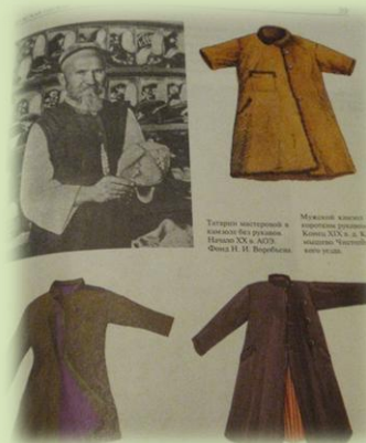
Мужской камзол с коротким рукавом. Конец XIX в.